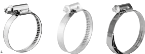
TORRO 9 mm

Ширина на скобата: 5; 7,5; 9; 12 mm Материал: W1; W3; W4; W5 Дизайн: Стандартен дизайн или със стоманена пружинна вложка.